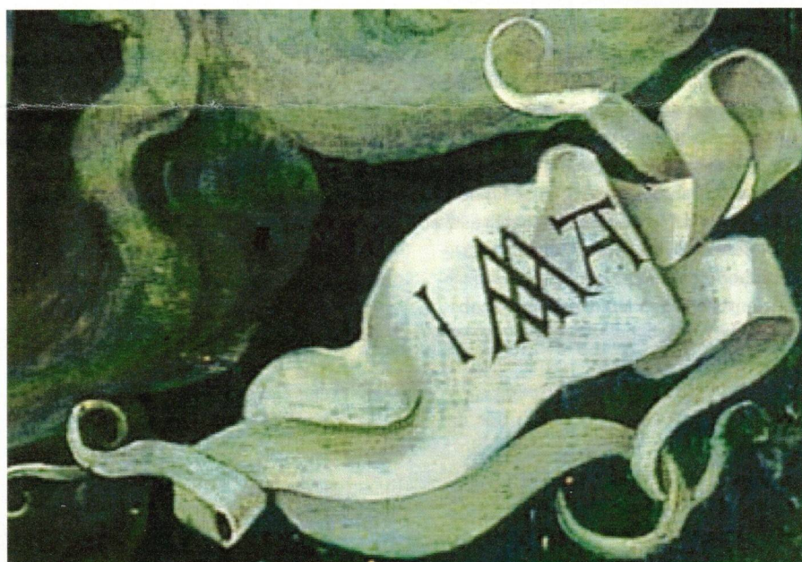
Afb. 5: Signatuur van Jacob Cornelisz. van Oostsanen. Het monogram met de ondersteboven geplaatste W fungeerde waarschijnlijk als 'logo' van Jacobs bedrijf in de Kalverstraat. Detail uit het Allerheiligentriptiek , 1523, Kassel, Schloss Wilhelmshöhe.

De familietak in Alkmaar had volgens Dudok van Heel een eigen monogram, dat een variant was van Jacobs omgekeerde W: een omgekeerde W met een dwarsbalk